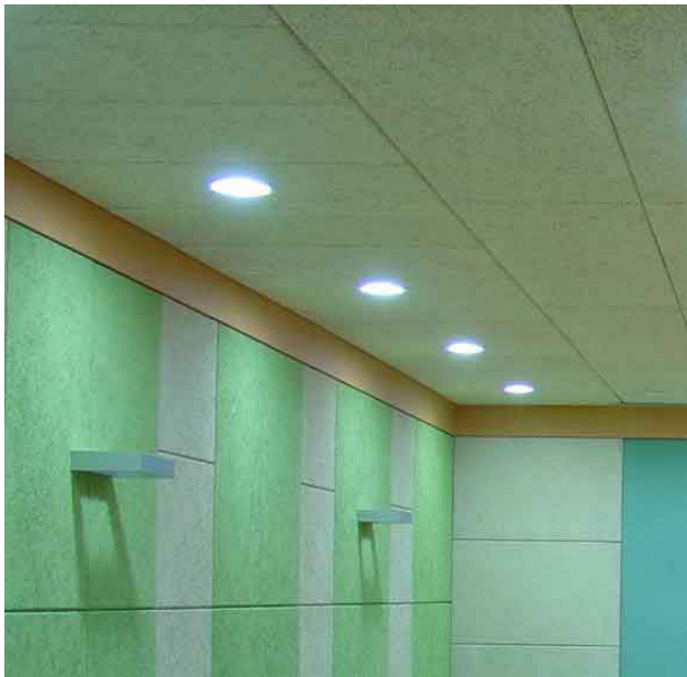
中国建筑材料监测认证中心视听检测室