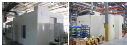
海尔冰箱生产线 噪声检测隔声罩

我司的组装式隔声罩的隔声板、隔声门、隔声观察窗、框架等采用模块式设计，通用化使用，具有拆装方便快捷、便于维修操作、降噪量从15-60dB(A)可选。因此可根据用户不同的要求组装从而降低成本。