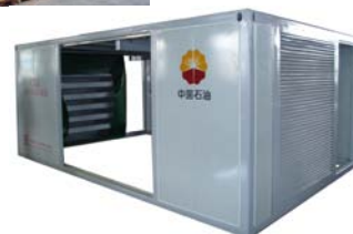
“中石油”天然气压缩机隔声罩

我司专为“中石油”提供配套的天然气压缩机隔声罩吸、隔声效果好，功能合理，外观美观。