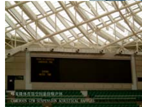
济南奥林匹克体育中心游泳馆 喀麦隆体育馆